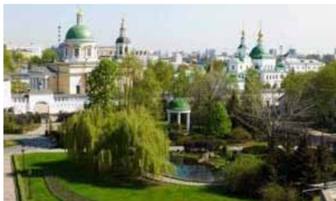
Вид из окна гостиницы